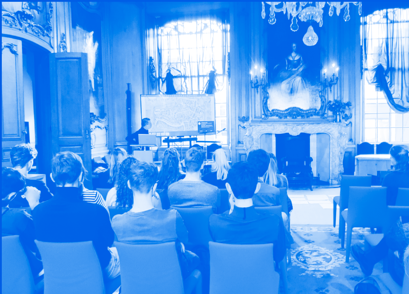
In gesprek met studenten stedenbouw van de NHL