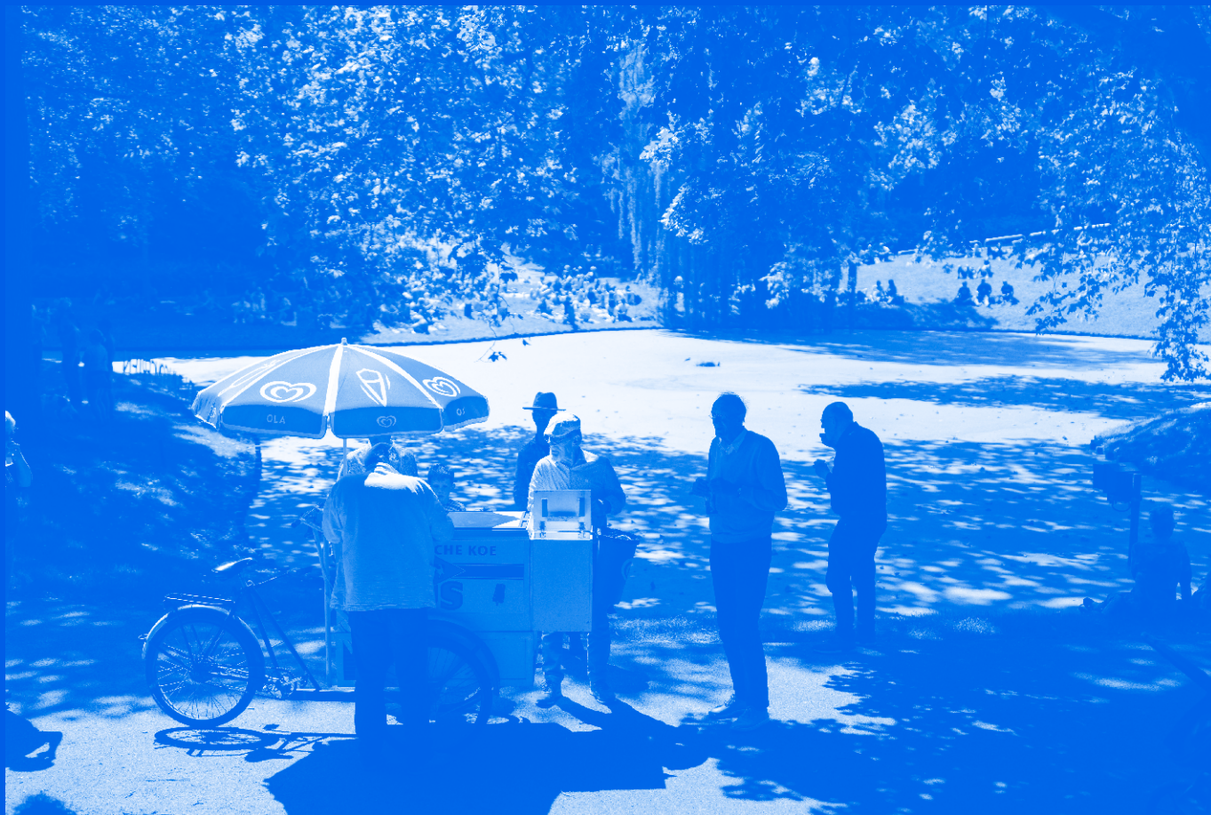
De Prinsentuin Leeuwarden