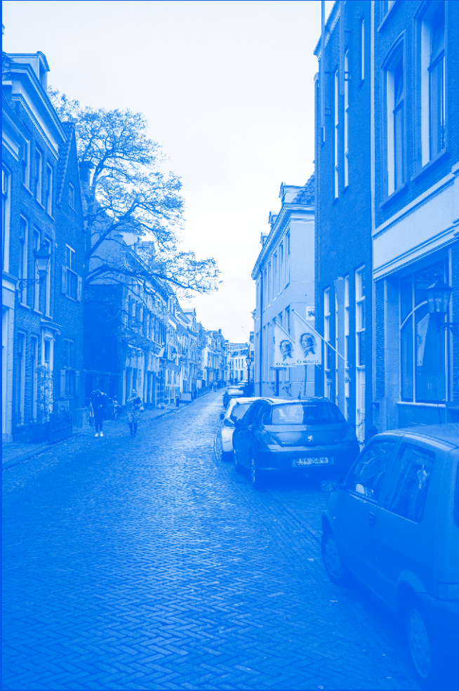
Historische bebouwing in de stad Leeuwarden