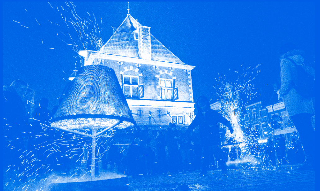
De stad als huiskamer