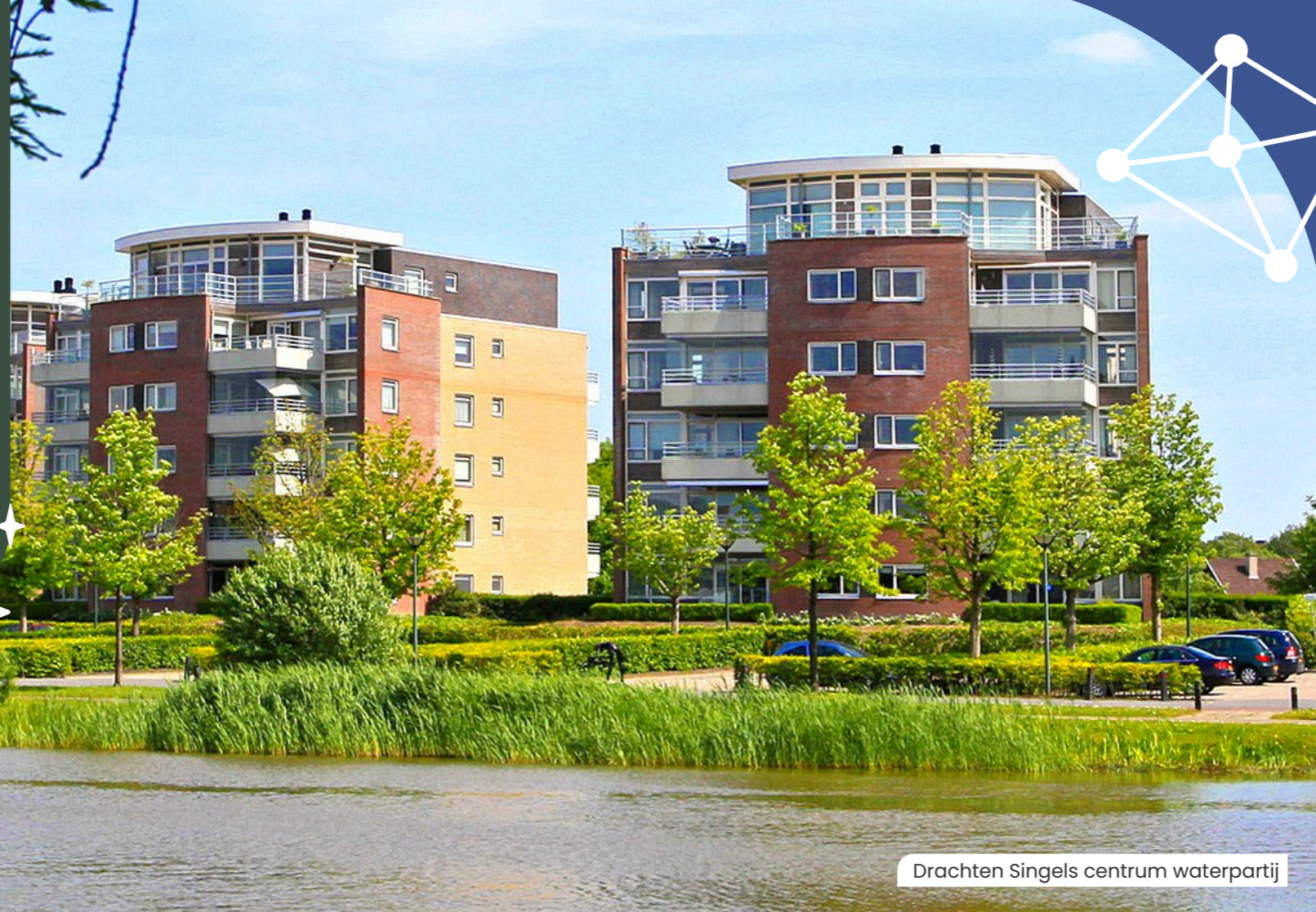
Drachten Singels centrum waterpartij