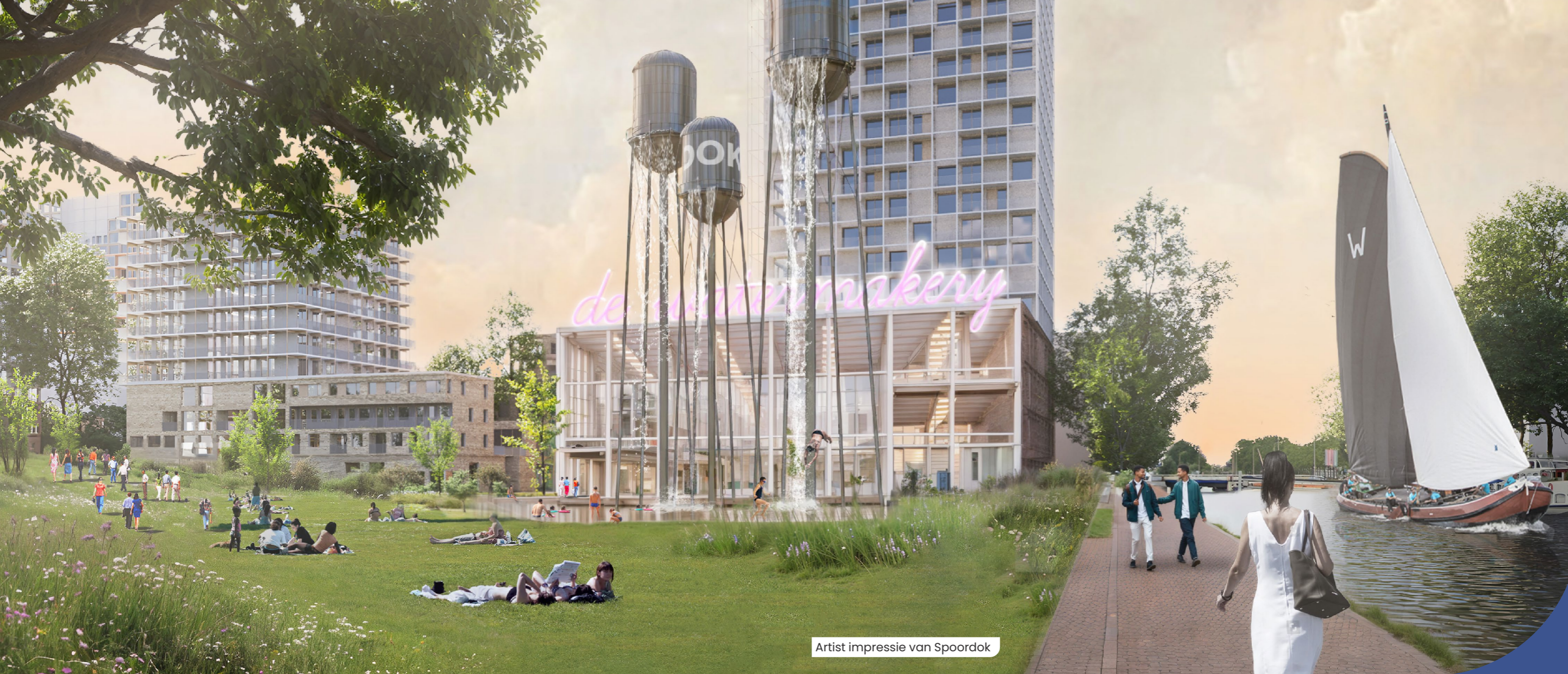
Artist impressie van Spoordok