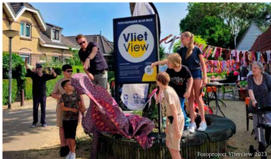
Fotoproject Vlietview 2023

Wijkpanels ontvangen jaarlijks geld van de gemeente voor activiteiten en/of investeringen in de wijk. Zij kunnen hiervoor bijvoorbeeld speeltoestellen aanschaffen, graffiti kunstwerken laten maken of initiatieven uit de wijk ondersteunen.