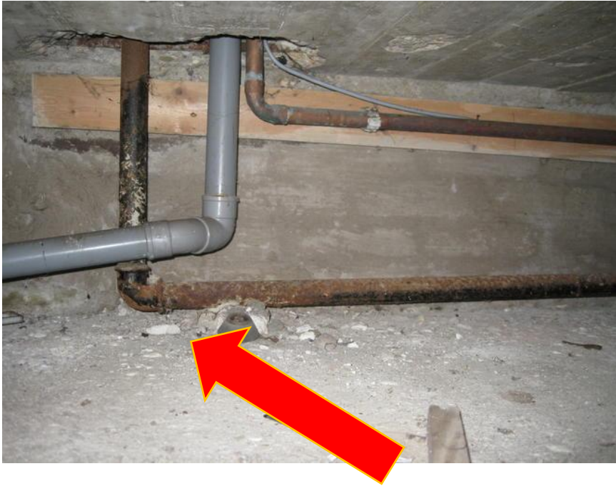
Figuur 3: aangetaste stalen gasleiding met koppelstuk in de kruipruimte