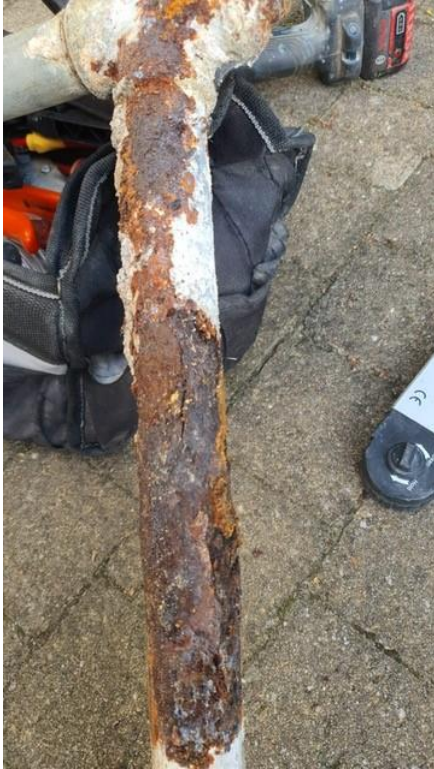
Figuur 1: aangetaste gasleiding

Onderstaand een aantal voorbeelden waarbij de stalen gasleiding is aangetast door roestvorming.