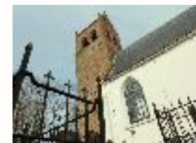
aan de andere kant . . . . .