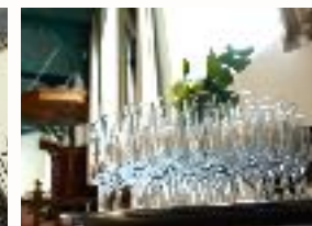
laat de champagne vloeien!