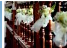
het doophek opgemaakt voor een trouwerij