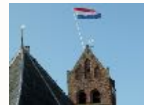
altijd een feestelijk gezicht, de vlag op de toren