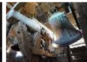
de klokken worden geluid