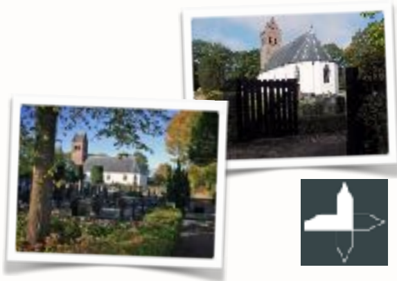
Dorpskerk Huizum, sinds nov. 2013 in eigendom van de Stichting Alde Fryske Tsjerken

Met een groep van zo'n vijftig vrijwilligers wordt deze kerk enthousiast tot een levendig centrum voor cultuur en bijeenkomsten gemaakt. Met respect voor het gebouw en z'n interieur kunnen er allerlei evenementen in plaats vinden. Naast de vaste programmering (twee tot drie keer per maand) zijn er zeer regelmatig koorrepetities, zodat van een veelvuldig gebruik gesproken mag worden. In de maximale opstelling biedt de ruimte plaats aan 200 zitplaatsen. Wanneer er een podium opgebouwd is, zijn er nog steeds 120 zitplaatsen beschikbaar. Voor de kleinere groepen geeft een opstelling in het koor een mooi besloten effect.